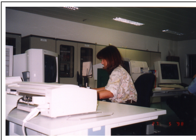
Sala de Comando

Para além dos edifícios já ligados à rede Urbana de Frio e Calor, serão Clientes da Climaespço todos os grandes edifícios do sector terciário e institucional actualmente em fase de construção.