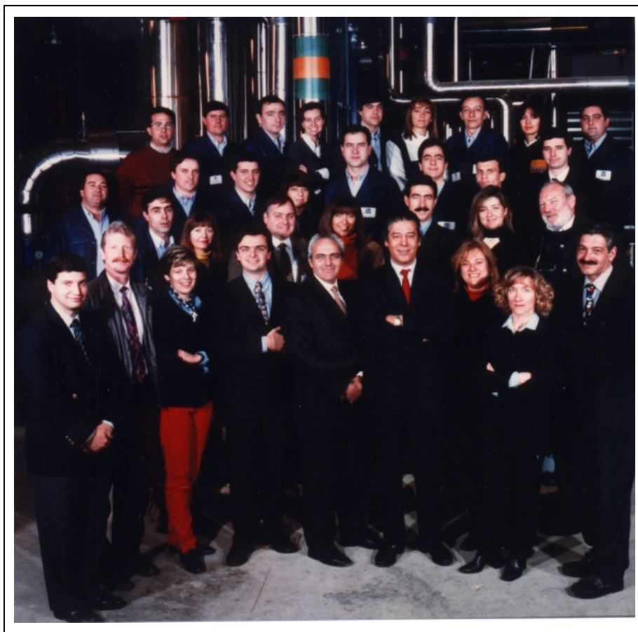
As Pessoas que realizaram este projecto

A Climaespço iniciou, assim, a sua actividade produtiva em Junho de 1997, com a ligação do seu primeiro cliente (a Portugal Telecom) à rede urbana de frio e calor, instalada na zona de intervenção da Parque EXPO'98, SA.