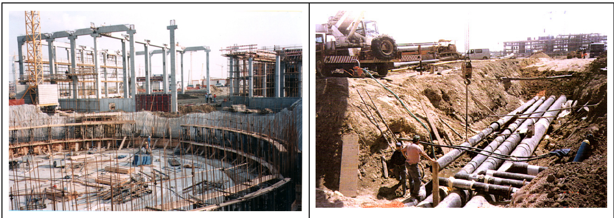
Construção da Central de Trigeração e depósito de armazenamento de água gelada

Só assim foi possível construir, em menos de 2 anos, um sistema de grande dimensão e de elevada complexidade, que entrou, parcialmente, em serviço no mês de Maio de 1997 para estar integralmente acabado à data da inauguração da Exposição Universal de Lisboa (EXPO'98), que se verificou em 22 de Maio de 1998.